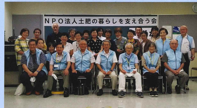
*この活動は、社会福祉法人信愛会 特別養護老人ホーム 土肥ホームより後方支援を受けております

更に、この活動を通し、高齢者自身の健康保持と地域における役割の確保・学生の福祉教育の一環として社会参加の機会など、地域住民同士が支え合う地域づくりを促進し、伊豆市土肥地区の地域包括ケアシステムの活性化と活動の一員としての地域貢献も目指します。